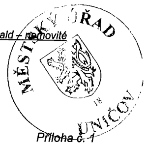
Seznam movitých věcí